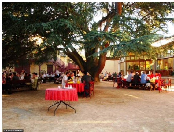
Diner dans la cour du cèdre aux Pianissimes 2008 pour La Française des Placements