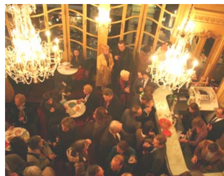
After à l'Athénée en décembre 2008

Un 'after' convivial. Remplacer l'entracte souvent trop long par un 'after' ouvert à tous permet de rassembler autour d'un verre le public, les invités et les artistes, pour des échanges informels.