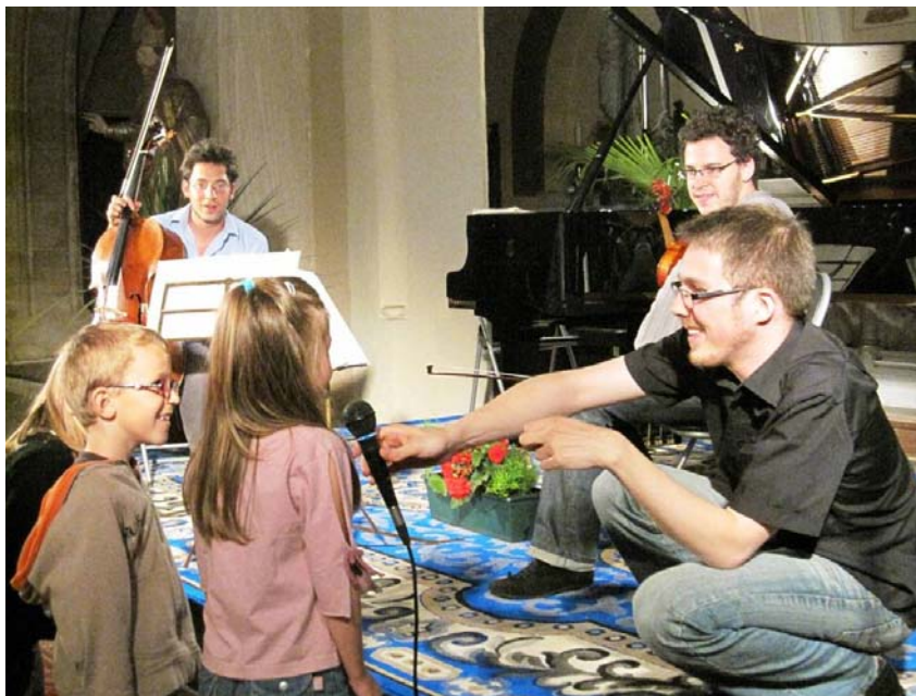
Le Trio con Fuoco aux Pianissimes 2009

L'un de nos objectifs principaux est de favoriser l'accès de nouveaux publics à la musique classique. C'est pourquoi nous avons mis en place de nombreuses actions depuis la création de Dièse en 2005.